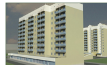
Многоэтажный жилой дом